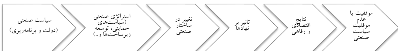
شکل (۱) رابطه علی و معلولی بین سیاست‌های صنعتی و پیامدهای اقتصادی

در مقاله حاضر، پس از ارائه تفسیر تاریخی دقیق از وضعیت هر یک از کشورهای ایران و ژاپن در زمینه‌های صنعتی، اقتصادی و سیاسی، تحلیل بین‌موردی برای مقایسه و تحلیل این دو کشور به‌کار گرفته می‌شود. واحد تحلیل در این