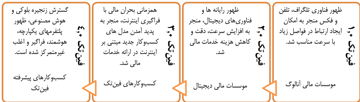
شکل (۱) نسل های مختلف فین تک (یافته های پژوهش)

به عنوان راه حل دولت ها جهت افزایش قدرت رقابت فین تک ها در کنار مدیریت ریسک های سیستمی اشاره کرده و آن را به دلیل ویژگی پنهان سازی ریسک ۳ راه حل ناکافی در حکمرانی فین تک ها معرفی می کند. آرنب و همکاران [۱۲] نیز با هدف افزایش مزایا و کاهش مخاطرات اقدام به بررسی حکمرانی فین تک ها نموده و نتیجه گرفته اند استفاده از تنظیم گری مبتنی بر اصول در مقابل تنظیم گری مبتنی بر قواعد، راه حل ارتقای حکمرانی فین تک است.