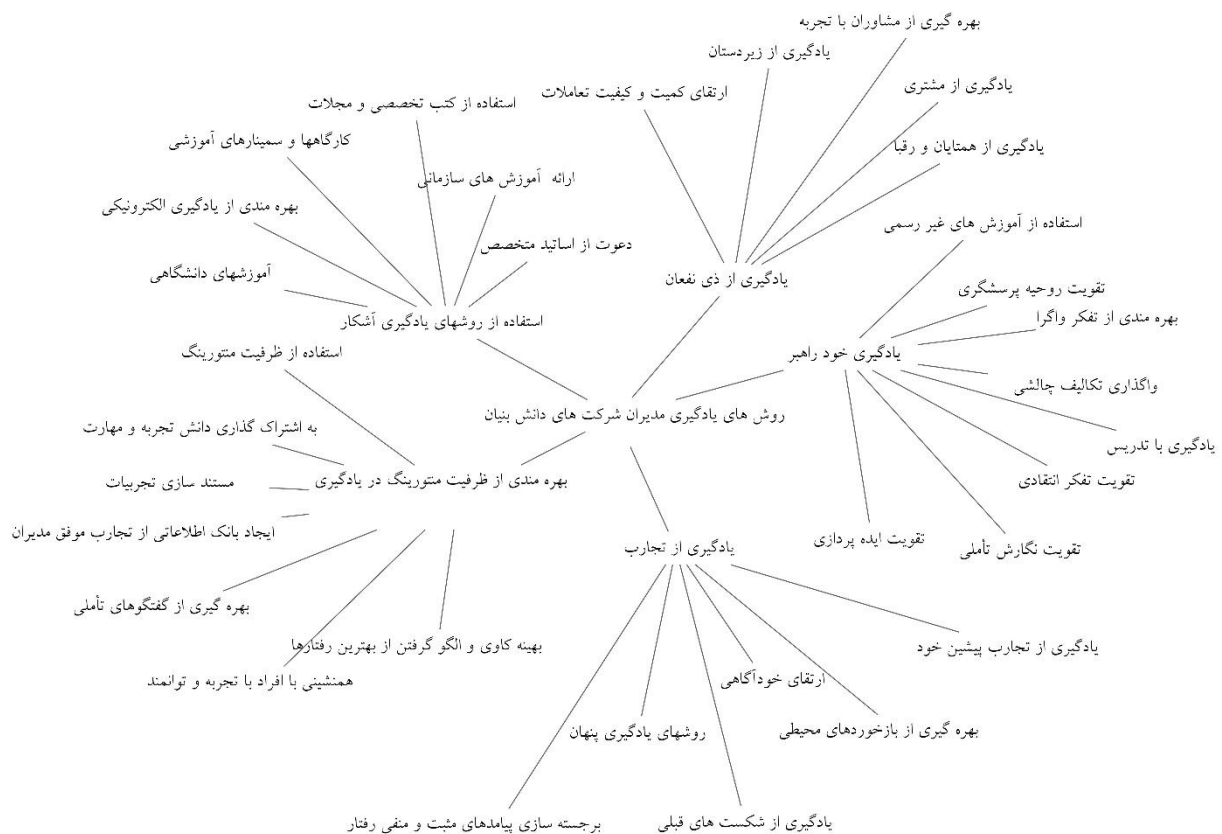
شکل ۱) روش‌های یادگیری مدیران شرکت‌های دانش‌بنیان

یکی از روش‌های یادگیری در مدیران شرکت‌های دانش‌بنیان از منظر مصاحبه‌شوندگان، یادگیری از تجارب است. استفاده از روش‌های یادگیری پنهان مانند بهره‌مندی از بازخوردهای محیطی و ارتقای خودآگاهی، جهت شناخت نقاط مثبت و منفی خویش و استفاده از تجارب پیشین و همچنین برجسته‌سازی عواقب رفتار منفی و پیامدها و دستاوردهای رفتار مثبت، جهت تغییر و تحول در نگرش فردی و الگو