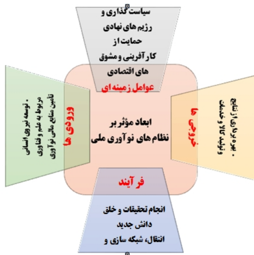
شکل ۲) مدل مفهومی پژوهش

همانطور که از جدول ۲ نیز قابل مشاهده است ورودی مدل شامل کارکردهای انسانی و مالی نظام نوآوری است. در بُعد فرآیند، کارکردهایی همچون خلق و انتشار دانش مطرح است و نهایتاً کارکرد بهره‌برداری از نتایج و تولید کالا و خدمات در بُعد خروجی مدل مشاهده می‌شود. دو کارکرد حمایت از کارآفرینی و مشوق‌های اقتصادی، سیاست‌گذاری و رژیم‌های نهادی نیز به عنوان عوامل زمینه‌ای بر روی تمام مراحل مدل تأثیرگذار هستند.