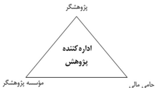
شکل ۱) سه حوزه اصلی در کارویژه‌های اصلی اداره پژوهش [۴۳]

تاکنون اداره‌کننده پژوهش را به صورت هم‌زمان دارای چهار نقش می‌داند که عبارت‌اند از: مدیر، متخصص مالی، حقوقدان و شبه پژوهشگر. او مبتنی بر این نقش‌ها، اصول اداره پژوهش در دانشگاه را در قالب چند گزاره زیر بیان کرده است که همگی نشان از نقش برجسته اداره پژوهش در جریان ارتباط پژوهشگر با مراجع بیرونی دارند [۴۴]: